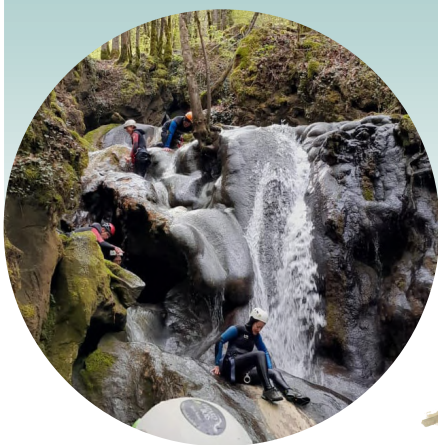
Groupe de canyoniste franchissant une tufière.