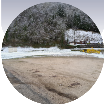
Parking clients & visiteurs