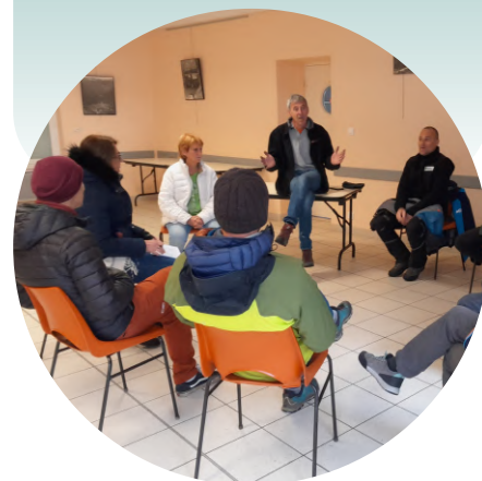
Réunion du Comité de gestion

Un comité de suivi piloté par la Communauté de Communes de la Plaine de l'Ain, réunissant les différents acteurs qui parcourent régulièrement le Ru de Chaley, a été créé. Il se réunit chaque année pour analyser la saison écoulée. Le comité de gestion émet des avis sur les mesures nécessaires à l'amélioration des conditions de pratique et de protection du milieu, ainsi que pour toute modification de la charte.